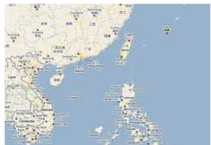
Bản đồ vùng biển Nam Trung Hoa và vùng biển Đông Trung Hoa mà Trung Quốc tuyên bố chủ quyền.